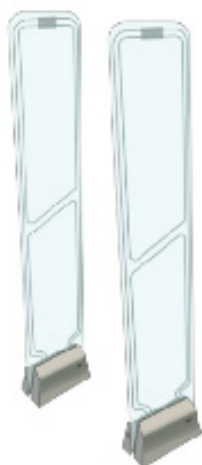
PORTIQUES ANTIVOL AM